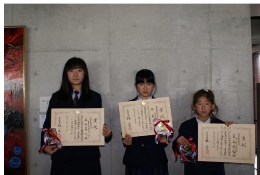
広島県議会議長賞