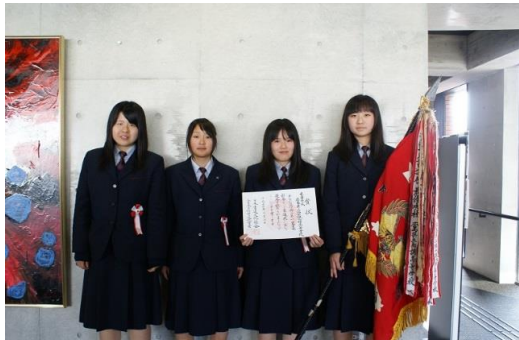
学校賞：広島県立福山誠之館高等学校

第1回全日本新春ネット書道展の特別賞を受賞した方々の表彰後の喜びの表情と喜びの声を掲載いたします。