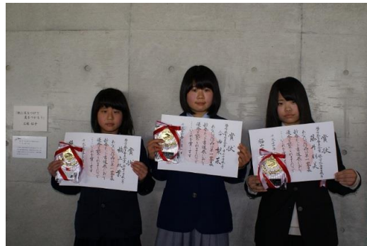
福山市教育委員会賞