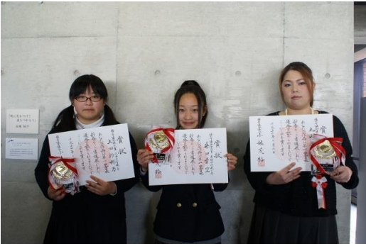
福山市議会議長賞