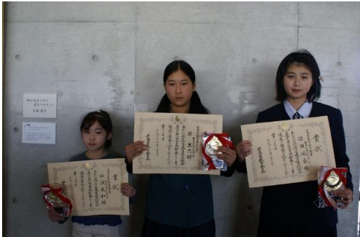
広島県教育委員会賞

高校入学を機に、再び書道を始め、改めて「筆を持つことが好きだ」と気づいた。立派な賞の嬉しさと益々頑張ろうと意欲が湧いている。ご指導をくださった先生に感謝します。