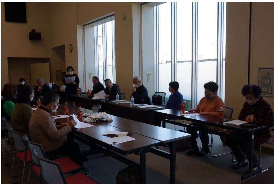
(第11回全日本新春ネット書道展 審査にあたって)